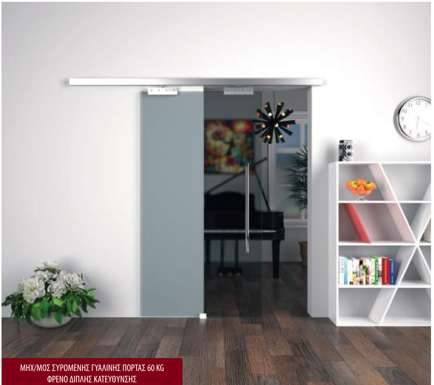
ΜΗΧ/ΜΟΣ ΣΥΡΟΜΕΝΗΣ ΓΥΑΛΙΝΗΣ ΠΟΡΤΑΣ 60 ΚΓ ΦΡΕΝΟ ΔΙΠΛΗΣ ΚΑΤΕΥΘΥΝΣΗΣ